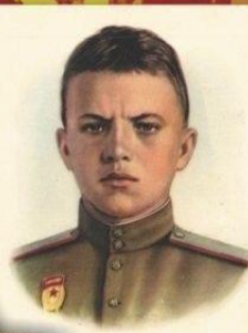
МАТРОСОВ Александр Матвеевич (1924–1943)

Военный лётчик, капитан, командир эскадрильи. Погиб 26 июня 1941 года совершая огненный таран: направил горящую машину на механизированную колонну врага.