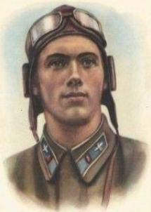
ГАСТЕЛЛО Николай Францевич (1907–1941)

Военный лётчик, капитан, командир эскадрильи. Погиб 26 июня 1941 года совершая огненный таран: направил горящую машину на механизированную колонну врага.