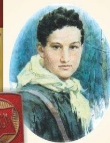
КОСМОДЕМЬЯНСКАЯ Зоя Анатольевна (1923–1941)

Военный лётчик, младший лейтенант, заместитель командира эскадрильи. Одним из первых в СССР совершил ночной воздушный таран немецкого самолёта-бомбардировщика.