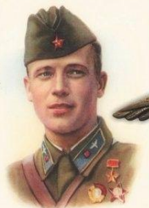
ТАЛАЛИХИН Виктор Васильевич (1918–1941)

Советский офицер, танковый ас. За два месяца 1941 г. уничтожил 52 танка противника, став самым результативным танкистом в Красной армии за всю историю Великой Отечественной войны. Погиб защищая Волоколамск.